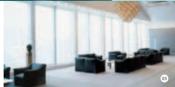
01. Flughafen Frankfurt/Main