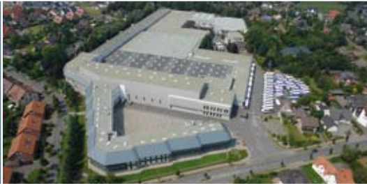
Werk in Verl