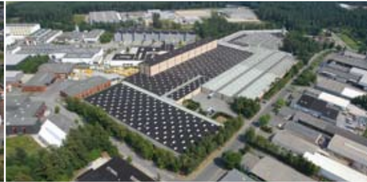
Werk in Hövelhof

Seit über 50 Jahren zählt heroal europaweit zu den führenden Aluminium-Systemhäusern für Fenster, Türen, Fassaden, Rolladen, Rolltore, Insektenschutz und Photovoltaik.