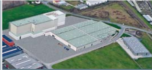
Werk II in Hövelhof

heroal hat den ausgeschäumten Rolladen erfunden und zählt seit über 40 Jahren zu den führenden Aluminium-Profilsystemherstellern, anfangs nur von Rolladen und Rolltoren, seit vielen Jahren jedoch auch in den Bereichen Fenster, Türen, Fassaden, Sonnen- und Insektenschutz sowie Photovoltaik.