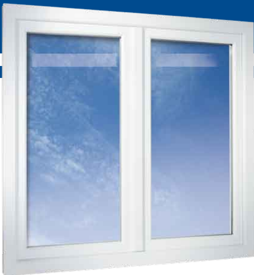
2-flügeliges Fenster in flächenversetzter Variante